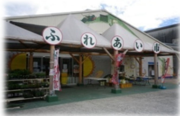
JA芸南 ふれあい市安芸津店