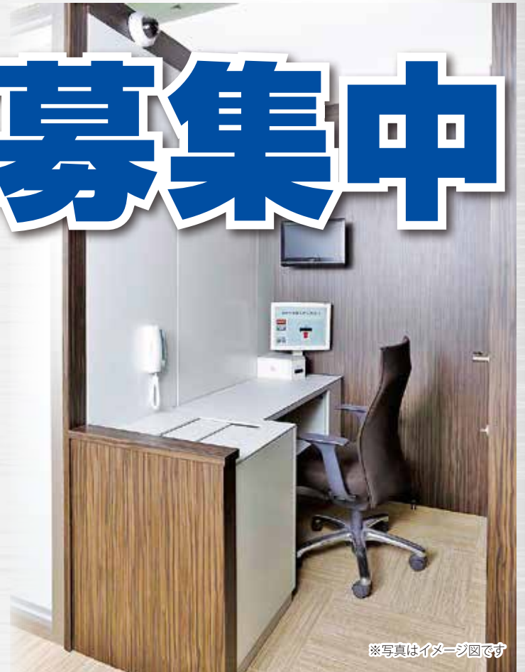
※写真はイメージ図です