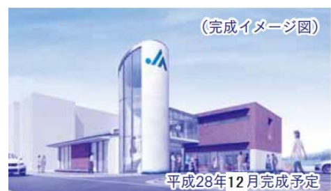
JA芸南川尻支所 予想図