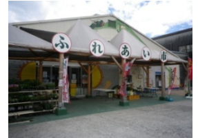
安芸津ふれあい市