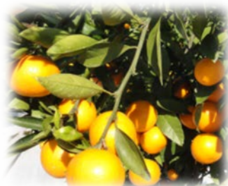
豊富なかんきつ類