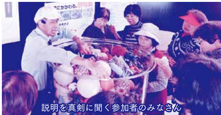
説明を真剣に聞く参加者のみなさん

万田酵素は、53種類の原材料を丸ごと使用し、水や添加物を一切使用しない自然発酵にこだわった商品づくりをおこなっていました。生産効率重視ではなく、良い商品を作るという考え方は、今後の加工クラブの商品づくりに大いに参考になると思われました。